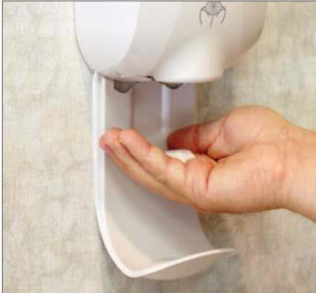
Friction avec solution hydro-alcoolique (SHA)