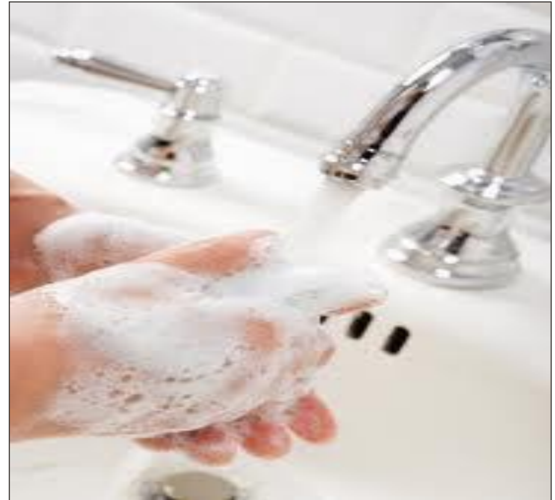
Lavage avec eau et savon