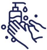
Lavage des mains