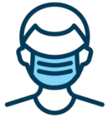
Port du masque en tout temps (incluant dans la chambre)